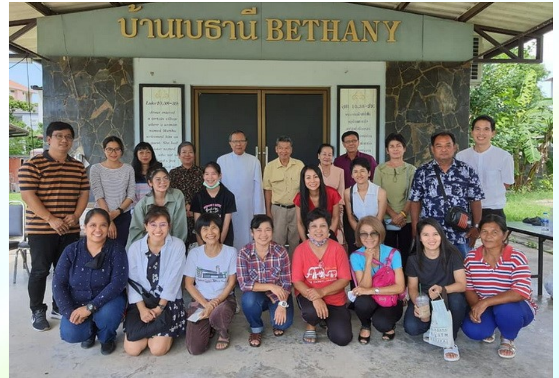
วัดบางแสนยังคงคุมเข้มต่อไป ไม่ทว่าไหว ไม่ประมาท การ์ดไม่ตก – มีสาววันอาทิตย์ 10.3 น.